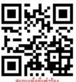
สแกนเพื่อยืมคำร้อง

เปิดให้บริการกู้ยืมเงินผ่านช่องทางออนไลน์ที่ www.olderfund.dop.go.th