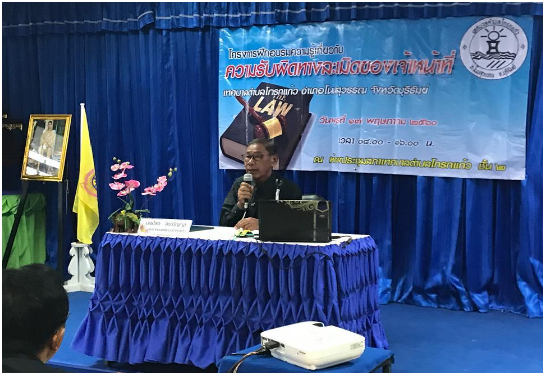
***โครงการสืบสานประเพณีของดีโนนสุวรรณ***