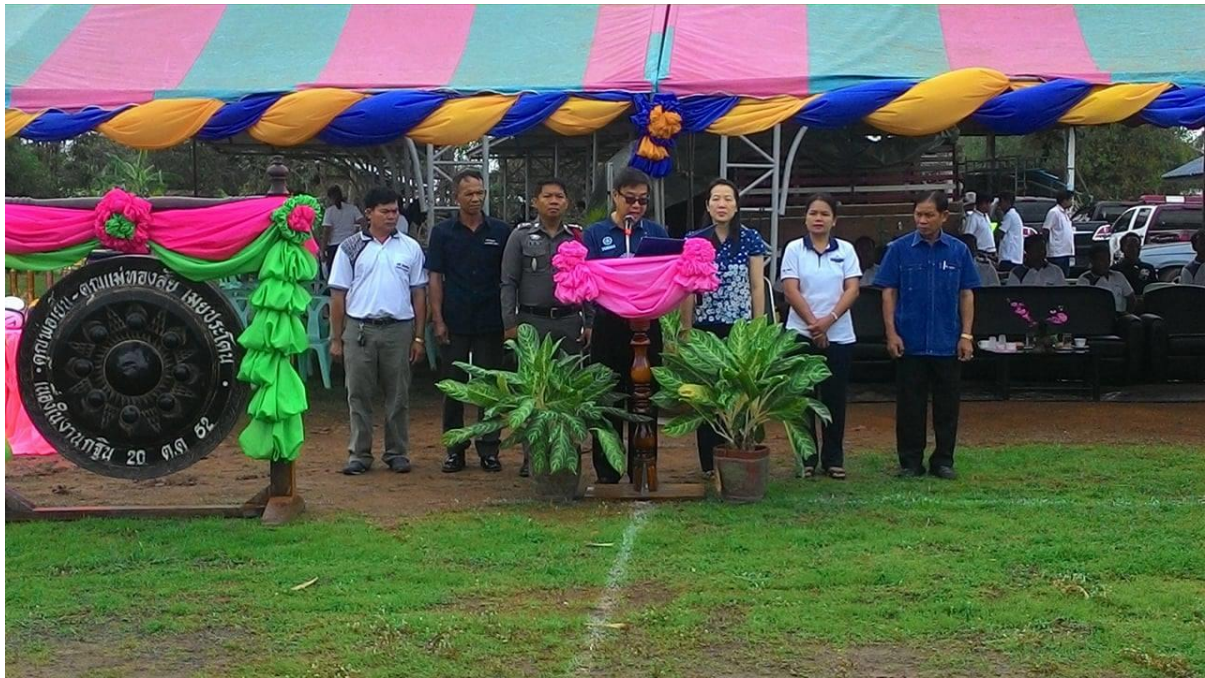
***โครงการอบรมคุณธรรม จริยธรรมแก่ครุผู้บริหาร สมาชิกสภา พนักงานเทศบาล และพนักงานจ้างเทศบาล ตำบลโคกแก้ว***